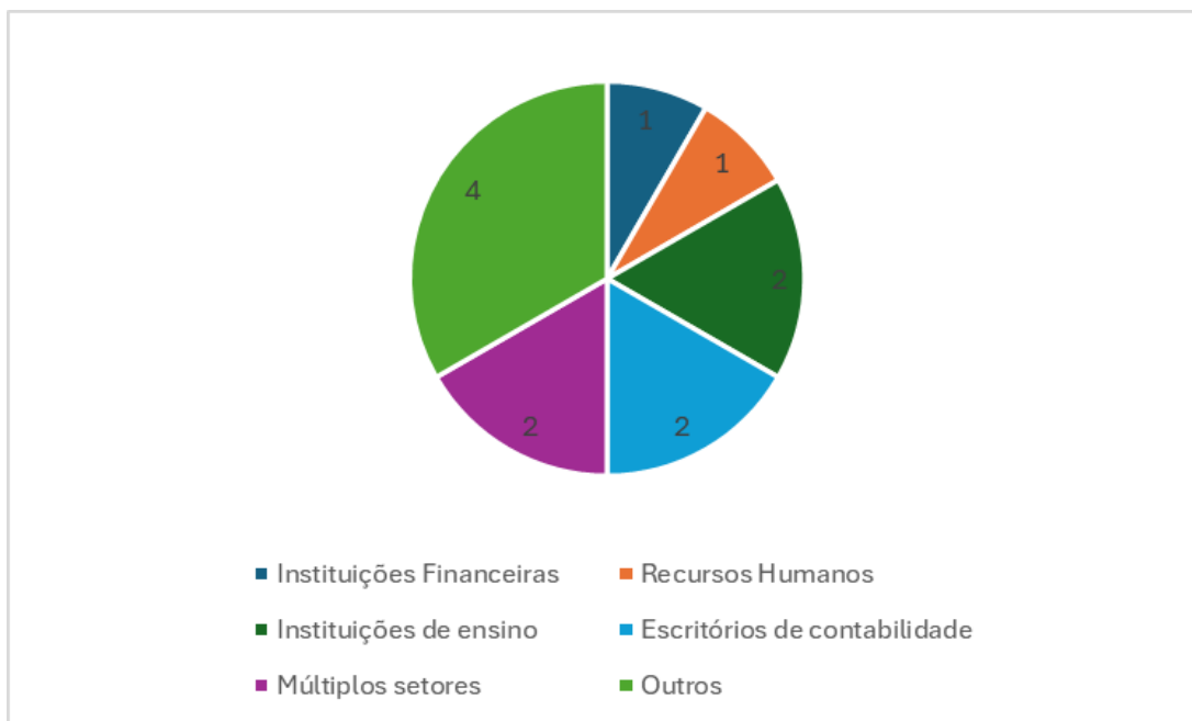
Figura 2: Setores analisados pela amostra